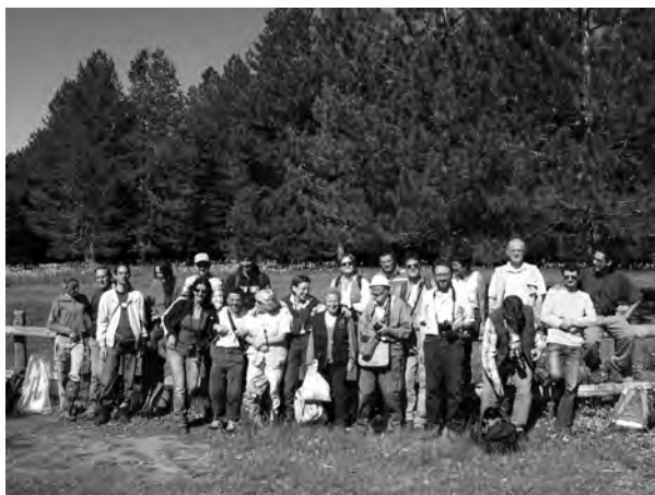
Fig. 1 Partecipanti all'escursione nella Presila Catanzarese. Participants to the excursion in Presila Catanzarese.

Nel 2008, la consueta escursione annuale del Gruppo per la Floristica della Società Botanica Italiana, finalizzata allo studio di territori poco indagati a livello nazionale, è stata effettuata nella Presila Catanzarese (Fig. 1).