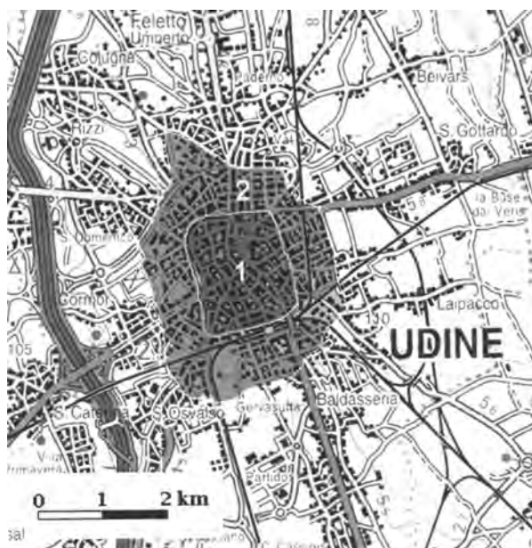
Fig. 4 Mappa di Udine con zone d'indagine. Map of Udine with areas of investigation.