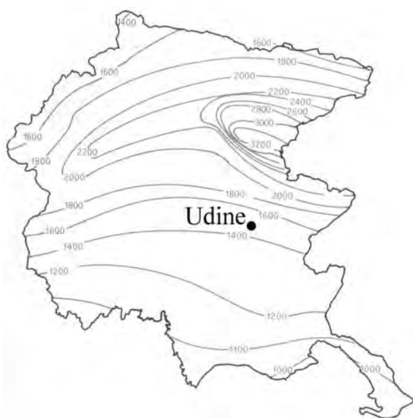
Fig. 3 Isoiete del Friuli Venezia Giulia (da POLDINI, 1991, modificato). Isoietes of the Friuli Venezia Giulia (from POLDINI, 1991, modified).

Moti d'aria periodici durante la giornata, in particolare le brezze di pianura, si fanno sentire con una intensità minima e sono del tutto trascurabili ai fini